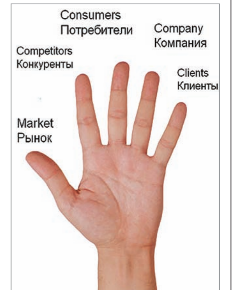
Рис. 3. Модель М4С: пять сил влияющих на развитие бренда

С – Consumers (потребители). Исследование целевой аудитории.